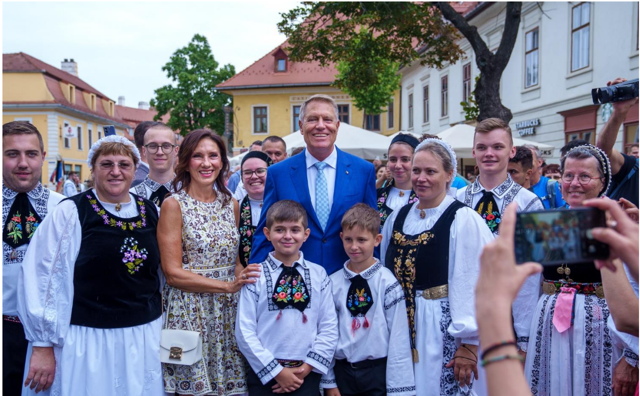
Participarea Președintelui României la Întâlnirea Internațională a Sașilor (3 august 2024, Sibiu)