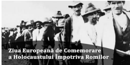
Ziua Europeană de Comemorare a Holocaustului Împotriva Romilor

”Cu prilejul Zilei Europene de Comemorare a Holocaustului Romilor, aducem un pios omagiu romilor care au fost victimele genocidului din timpul celui De-al Doilea Război Mondial și ne reafirmăm angajamentul pentru prețuirea și apărarea drepturilor fundamentale și a demnității umane.