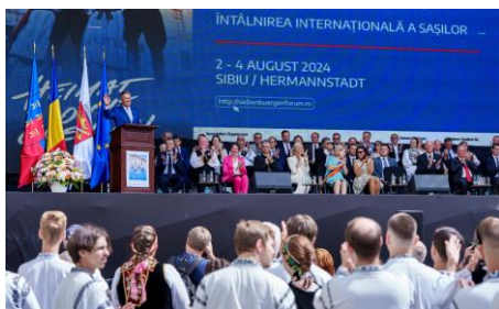
Pentru mai multe imagini, click pe poză

Amintirea acestui trecut - cinstirea valorilor sale, onorarea suferințelor și a sacrificiilor din care el a fost ridicat- este în ADN-ul sașilor transilvăneni și face ca ei, oriunde s-ar afla, să nu-și uite pământul natal și să nu-și abandoneze tradițiile unei identități respectate și admirate pe toate meridianele. Suntem reprezentanții unei comunități