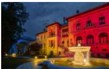
Pentru mai multe imagini, click pe poză

Limba română, învățată de copii de la părinți și de la dascăli, poartă peste generații întregul tezaur literar, științific și artistic pe care cultura noastră îl oferă lumii. Astfel, ca un arc peste timp, se cultivă respectul și dragostea pentru limba lui Mihai Eminescu.