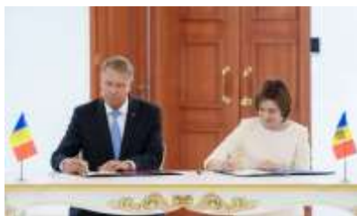
Pentru mai multe imagini, click pe poză

Reafirmând obiectivele trasate prin Parteneriatul Strategic bilateral pentru integrarea europeană a Republicii Moldova (București, 27 aprilie 2010) și Declarația comună a Președinților României și Republicii Moldova (Chișinău, 29 decembrie 2020),