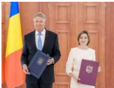
Pentru mai multe imagini, click pe poză

Salut și faptul că în aceste zile are loc o nouă ediție a Salonului Internațional de Carte Bookfest Chișinău.