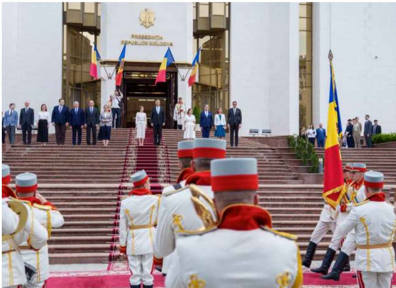
Vizita oficială a Președintelui României în Republica Moldova (31 august 2024, Chișinău)

NEWSLETTER nr. 429 din 5 septembrie 2024